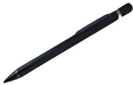
Lápiz óptico activo