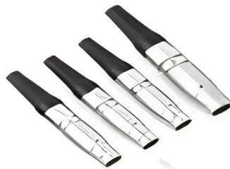
Conector de aviación